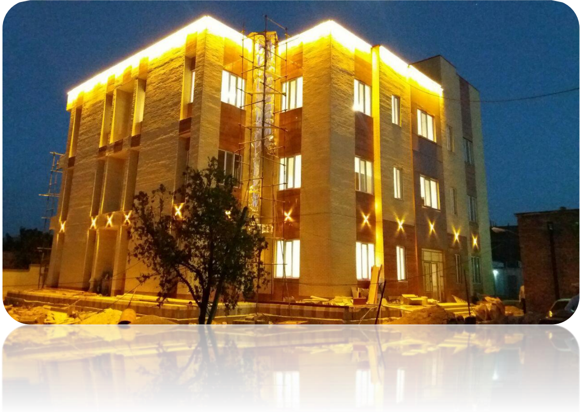
مرکز بهداشت گوگان

سیاست این حوزه واگذاری اختیارات به شبکه است در این راستا شبکه یک نفر کارشناس بعنوان رابط پروژه های عمرانی به این حوزه معرفی می کند و طبق تفویض این حوزه ایشان می تواند تا سقف معینی تعمیرات لازم را انجام دهد. بدیهی است برای سقف بیشترهماهنگی با این حوزه لازم است.