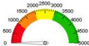
شاخص MTBF (شش ماهه)

مقدار فعلی: ۱۰۰,۰۰٪ مقدار بهینه: ۸۰ انحراف: ۲۰,۰۰- | افزایش | اشتراک