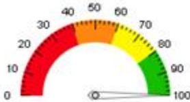
شاخص Availability (شش ماهه)

مقدار فعلی: ۱۰۰,۰۰٪ مقدار بهینه: ۸۰ انحراف: ۲۰,۰۰- | افزایش | اشتراک