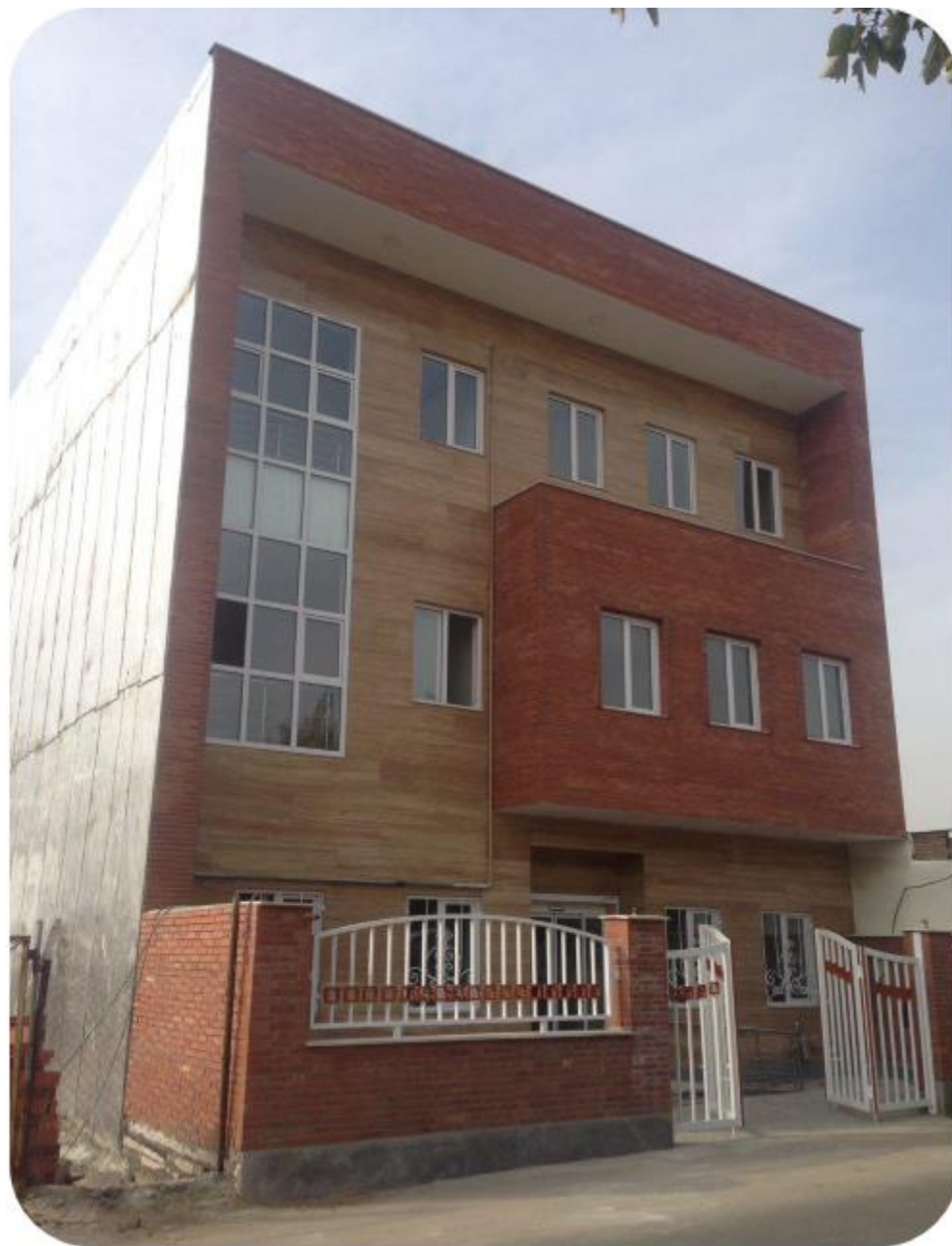
مرکز سلامت ستارخان

انجام کلیه تعمیرات پس از تامین اعتبار با شبکه است ولی برای هرگونه احداث جدید و توسعه فضاهای فیزیکی قبل از اقدام اخذ مجوز لازم از معاونت بهداشت ضروری است.