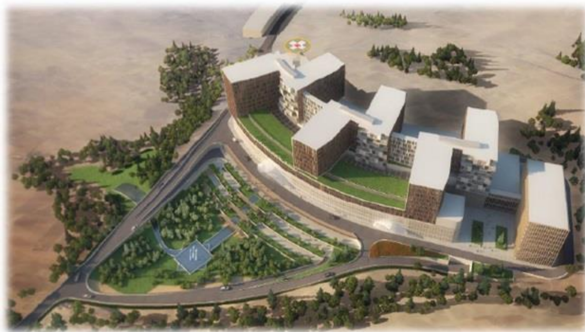
بیمارستان ۱۰۰۰ تختخوابی تدبیر

قبل از ورود به بحث اصلی یادآور می گردد بطور کلی می توان پروژه بیمارستان را از سایر پروژه ها جدا کرد چرا که بیمارستان به لحاظ فنی و ویژگیهای خاص خود دارای اهمیت زیادی است.