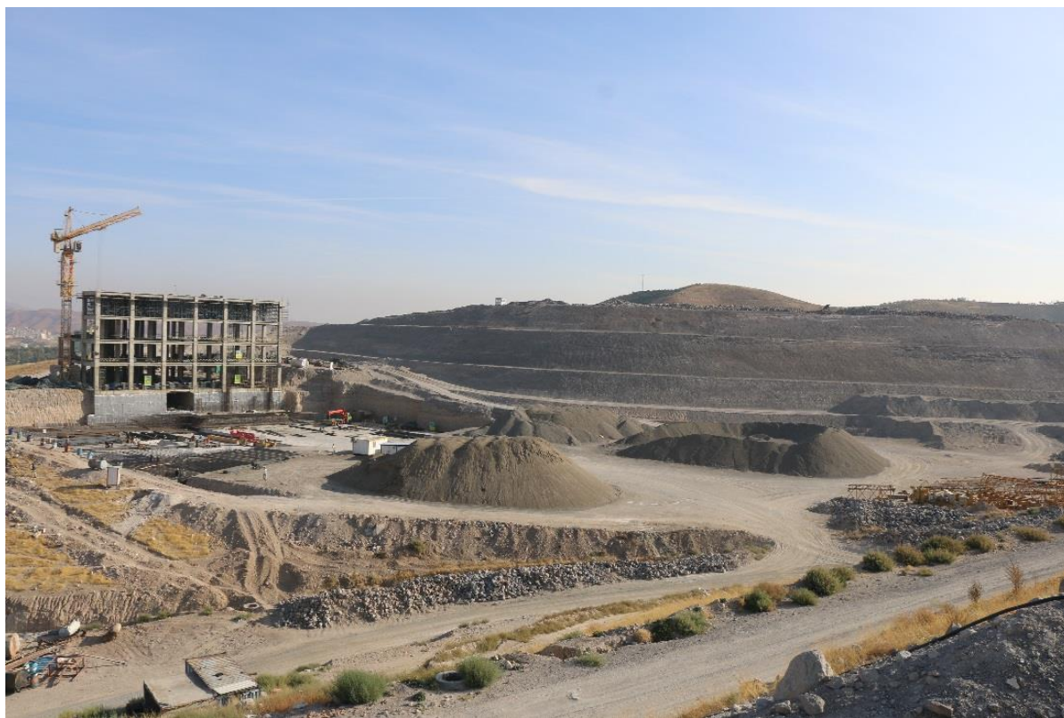
بیمارستان ۱۰۰۰ تختخوابی تدبیر